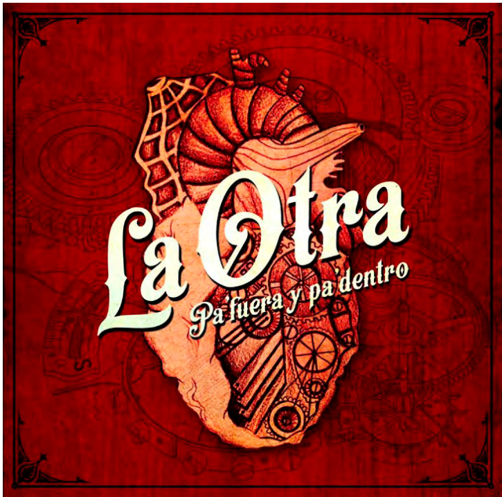
PA´FUERA Y PA´DENTRO ( 2016 )