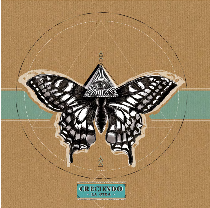
CRECIENDO ( 2018 )